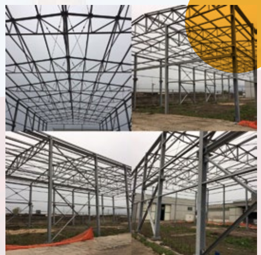
Capannone scambio ferroviario, Italferr. Marcianise, Caserta Italia.