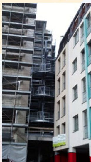
Scala di emergenza e castelletto ascensori, Palazzo di Giustizia Lecco. Italia.

Il know-how acquisito con l'orientamento al problem solving ha permesso la realizzazione di opere e costruzioni per Enti e Aziende.