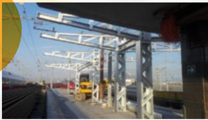
Prolungamento pensiline binario 18 e 19, stazione Napoli Centrale. Napoli, Italia.