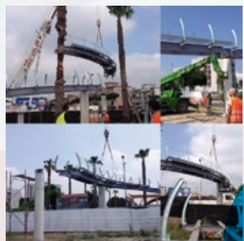
Archi in Corten e ponte pedonale, passeggiata parco urbano. Giugliano in Campania, Italia.