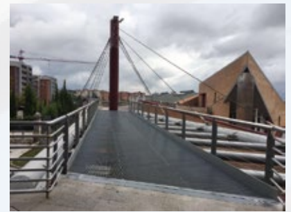
Ponte pedonale, Università del Molise. Campobasso, Italia.